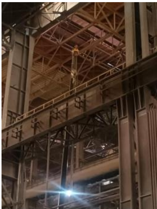
图3 吊装位置和过渡跨走台间的位置