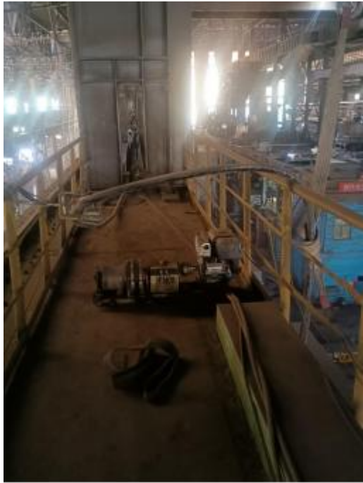
图1 过渡跨西侧走台内现场情况